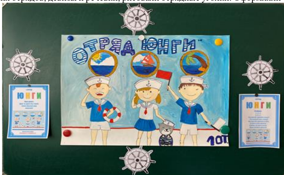
1 отряд – «Юнги»

В первый день лагерь был разделен на 14 отрядов. Дети в течение первого дня придумывали названия отрядов, девизы и речёвки, рисовали отрядные уголки. Оформляли «лицо отряда», например: