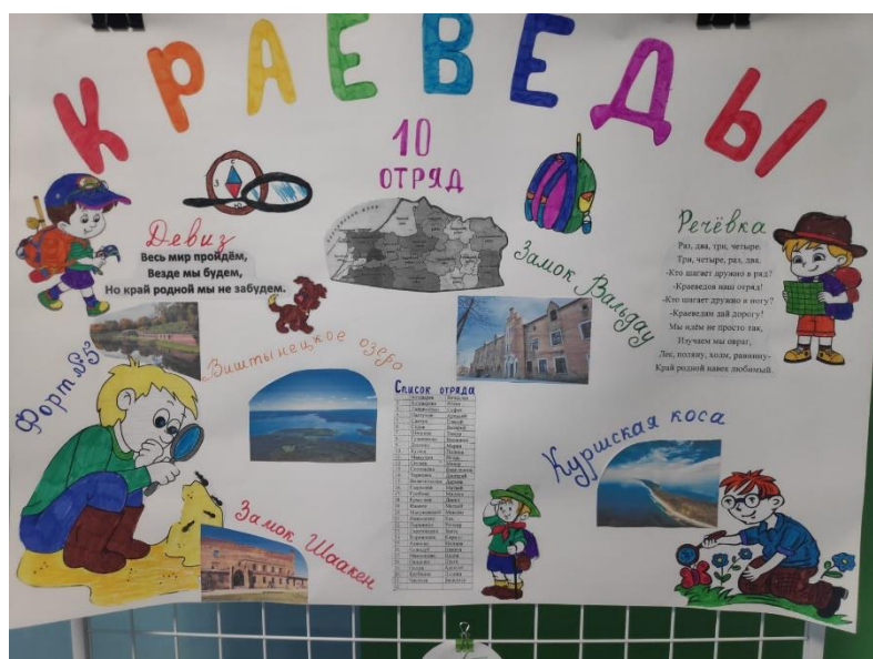
10 отряд – «Краеведы»

Каждый отряд представлял один коллективный проект. Какую тему о родном крае будет представлять каждый отряд определилось при жеребьёвке на торжественном открытии 1 смены.