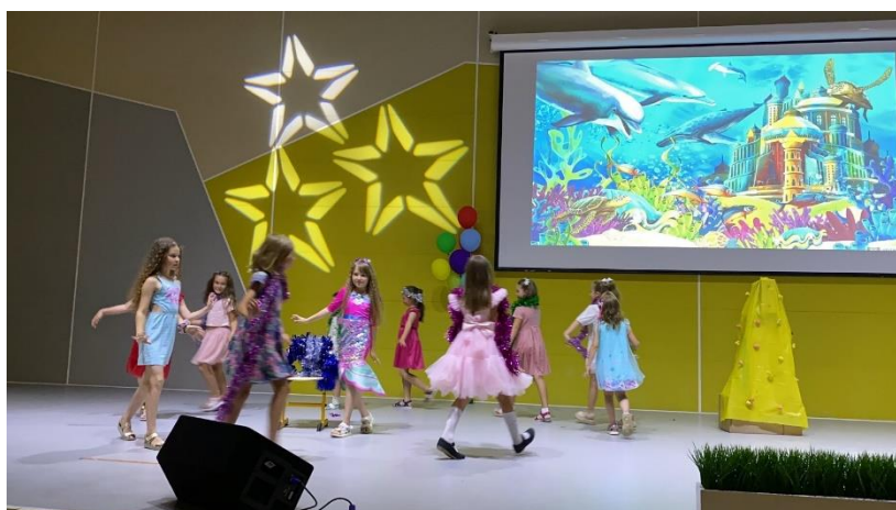
4 отряд - проект «Легенды о янтаре»

На торжественном закрытии лагеря были подведены итоги Фестиваля проектов и конкурса на Лучший отряд. Все отряды были награждены грамотами.