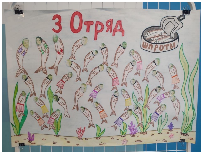
3 отряд – «Шпроты»