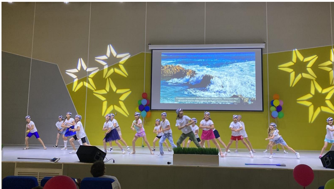
1 отряд – проект «Калининград – морские ворота России»