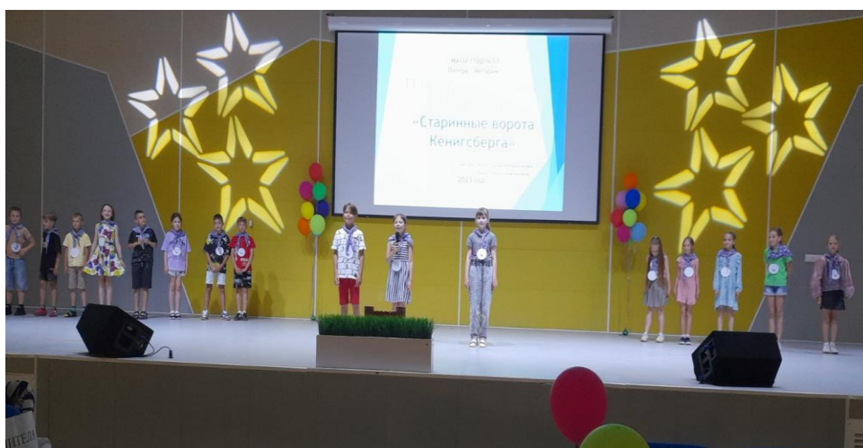
11 отряд – проект «Старинные ворота Кёнигсберга»